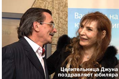
Целительница Джуна поздравляет юбиляра

Должен сказать, что лично мне нравятся оригинальные полотна и рисунки Шагеева на тему гольфа. В них много фантазии, иронии, масса образов и деталей, которые заставляют смотреть и изу-